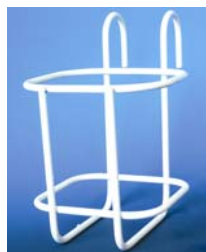
Panier « balconnier » pour chariot Réf. : 305710 ; 305251 ; 305252 ; 305254