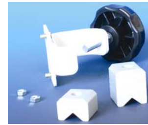
Adaptateur pour fixation sur barre Réf. : 305636