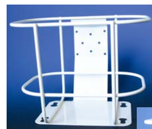
Panier pour plan de travail ou pour chariot Réf. : 305654 ; 305250 ; 305253 ; 305255