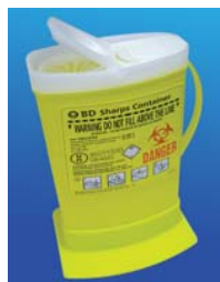
Socle pour plan de travail Réf. : 305964