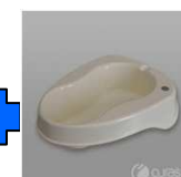
Ref. 08000 + 08110