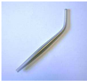
REF 1180113050 Mini